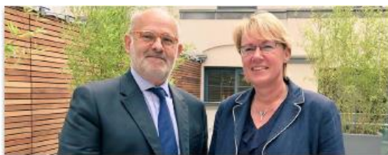
Przewodniczący EDA Michel Nalet — Minister Barbara Otte-Kinast

"Dolna Saksonia jest rolniczym landem numer 1 Niemiec. Wobec 9,5 mln ton rocznej produkcji mleka, Dolna Saksonia mogłaby sama być 7-mym najważniejszym krajem mleczarskim w UE-28, zaraz po Włoszech. Dolna Saksonia jest także miejscem znakomitych zakładów mleczarskich, takich jak ta, której jestem członkiem" powiedziała na wstępie Minister Barbara Otte-Kinast .